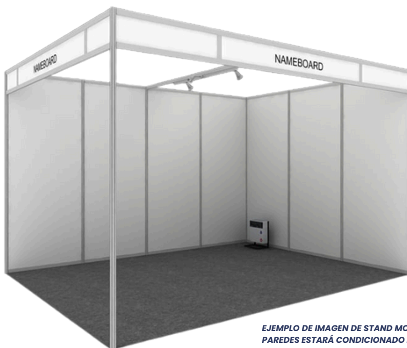
EJEMPLO DE IMAGEN DE STAND MODULAR BASIC ABIERTO A 2 PASILLOS. EL NÚMERO DE PAREDES ESTARÁ CONDICIONADO POR LA UBICACIÓN DEL STAND.